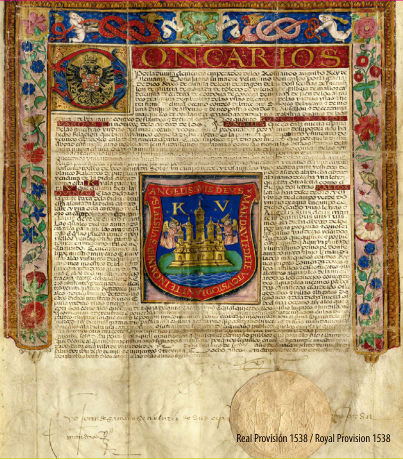
Real Provisión 1538 / Royal Provision 1538